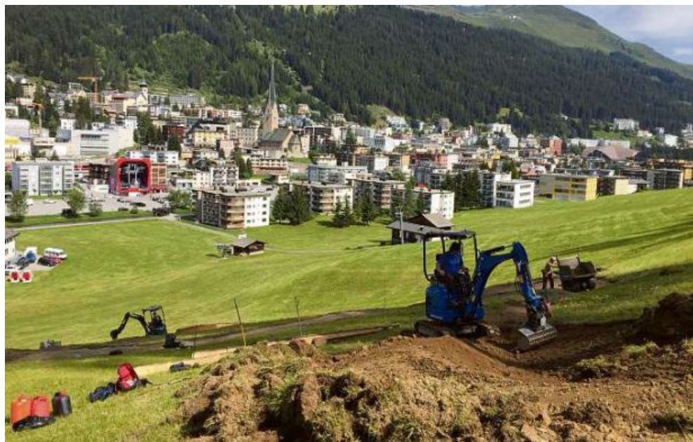
Die «Chügalibahn» während der Bauarbeiten.

Ein weiterer Teil des Gesamtprojekts ist die Schaffung eines neuen Trail-Teilstücks unterhalb der Ischalp. Neu soll der Trail direkt bei der Mittelstation der Jakobshornbahn beginnen, der Einstieg über die Forststrasse entfällt dann. Sobald in den nächsten Jahren die notwendige Bewilligung für diesen Abschnitt erteilt ist, kann auch diese Lücke noch geschlossen werden.